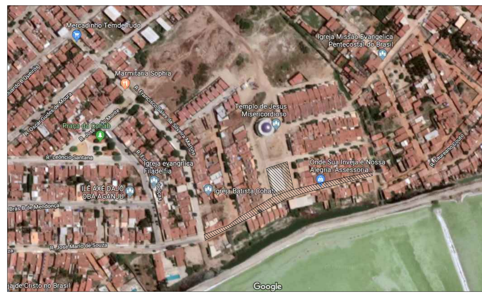
ÁREA A SER TRABALHADA